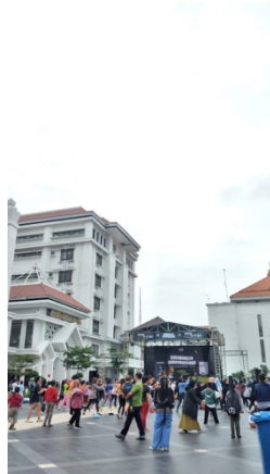
Gambar 2. Aktivitas pada ruang public balai pemuda

Berikut contoh pelanggaran batas pada ruang publik dan semi publik pada Balai Pemuda Surabaya: