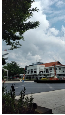
Gambar 1. Ruang public balai pemuda